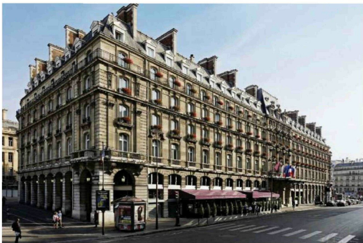
Le Hilton Paris Opéra a ouvert en février dernier.