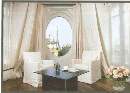
CI-DESSUS. SOBRE, D'UN LUXE INTEMPOREL, LE METROPOLITAN DANS LE XVI e OFFRE DES VUES IDYLLIQUES SUR LA TOUR EIFFEL. CI-CONTRE, RUSTIQUE CHIC AU HIDDEN, TOUT PRÈS DE LA PLACE DE L'ÉTOILE.