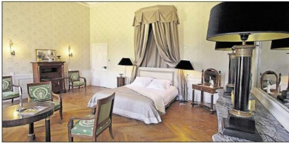
■ La chambre Monopoly du château de Pennautier, berceau de la famille Lorgeril depuis 1620.

Tourisme | Pour des week-ends de détente et de charme.