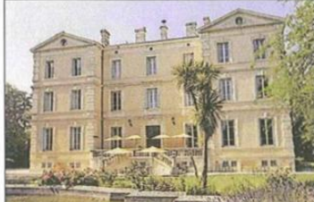
Dans le Gard, des pièces d'or à Montcaud...