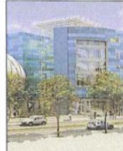
Derrière cette façade catalane, un complexe nouvelle génération.

Un hôtel 4* (Quality) et un hôtel 3* (Choice Comfort) sous le même toit. C'est le pari de l'enseigne Book Inn France qui, quartier Saint-Assisole à Perpignan, ouvrira deux établissements de 46 et 55 chambres. Situés au sein du nouveau pôle de la gare TGV « El Centre del Mon », ces hôtels design font partie d'un programme qui rassemble boutiques, spa, centre sportif et restauration rapide. Inscrits dans une démarche environnementale avec un toit photovoltaïque, cette double adresse, dont l'architecture intérieure est signée Alexandre Danan, opte pour l'ultra-contemporain et des tonalités noires et blanches. Prix de lancement : 89 € la nuit. 01 44 70 81 13.