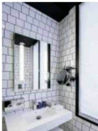
Une salle de bains.