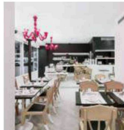
La salle des petits déjeuners.