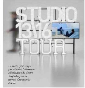
Le studio 13/16 conçu par Mathieu Lehanneur à l'initiative du Centre Pompidou pour le tourné dans tous la France.

Le studio 13/16 du Centre Pompidou se fait tirer en 2013 et 2014. Une tournée des centres commerciaux français qui a été inaugurée au Forum des Halles à Paris au mois de mai et qui va se poursuivre à La Toison d'Or à Dijon du 6 au 20 juillet et à Rosny-sous-Bois du 19 au 2 novembre et qui se poursuivra à Confluence à Lyon et à Eurallie à Lille en 2014. Initié par le Centre Pompidou et Unibail-Rodanco, conçu par le designer Mathieu Lehanneur, le studio 13/16 est un espace qui accueille les adolescents depuis la rentrée 2010, dans le cadre d'une programmation originale basée sur l'expérience. Des ateliers gratuits - et maintenant ambulants - encadrés par des animateurs professionnels du musée seront proposés ainsi que le workshop "Serial Printer" où le graphiste Jean Julien invitera les participants à s'approprier les motifs qu'il a imaginés sur le thème de la mode pour les reproduire sur des supports du quotidien.