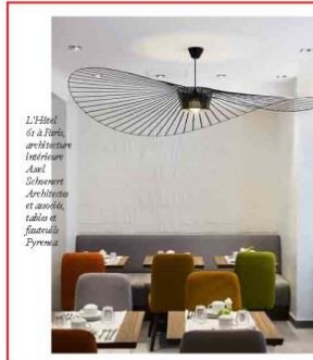
L'Hôtel 61 à Paris, architectes Axel Schoenert Architectes et Associés, tables et fauteuils Pyreneal.

Les architectes de l'agence Axel Schoenert Architectes et Associés (ASAA) rangent leur dernière réalisation, l'Hôtel 61, dans la catégorie "vintage" parce que le bois teinté noyer y est présent, à l'accueil, dans les chambres en tête de lit et dans le mobilier (tables et fauteuils réalisés par Pyreneal). De vintage, il en offre surtout les dimensions modestes et fonctionnelles, stigmates d'un mobilier de l'Après-Guerre, économe en formes, en volume et en matériaux. Par sa rénovation au sein du Paris Inn Group, il a gagné une quatrième étoile, ce qui le fait monter en gamme. Les couleurs - jaune safran, vert émeraude, gris orage, bleu azur et orange paradis métamorphose l'ex "Jardins de Paris Nation" en "Best Western Premier 61 Paris Nation Hôtel". Aux murs, les photos de Mureo, prescripteur d'images auprès des architectes, rendent hommage aux années 60 et à leurs égéries.