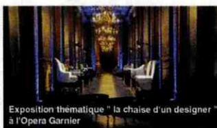
Exposition thématique " la chaise d'un designer " à l'Opéra Garnier

lequel j'ai signé l'établissement hôtelier Collectionneur (5*), ex-Hilton Arc de Triomphe. Il y a également des corps d'état précieux qui parachèvent vos idées et en subliment les moindres détails. Enfin, ce sont des espaces d'expression de choix, notamment pour ce qui est du mobilier unique que je dessine et n'est jamais réédité.