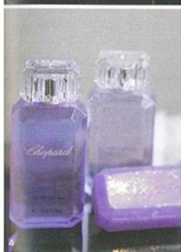
3 客室の洗面所の鏡にはテレビが内蔵され、メイクしながらでも見られる。 4 アメニティはショパール。 5 客室の壁紙はクロコダイル風。ベッド・ヘッドやコンソールなど随所にスワロフスキーが飾られてリユクスに。