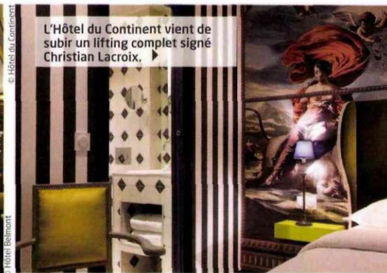
L'Hôtel du Continent vient de subir un lifting complet signé Christian Lacroix. ▶