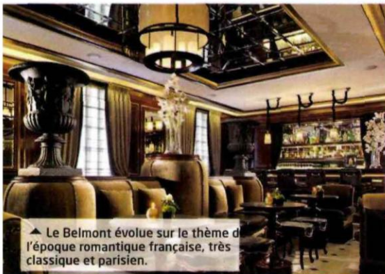
▲ Le Belmont évolue sur le thème de l'époque romantique française, très classique et parisien.