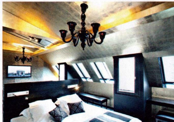
Dans un subtil jeu de références à l'alchimie, l'or a été utilisé avec finesse par l'architecte décorateur Alexandre Danan .

Les chambres se déclinent en rouge, prune, orange, bleu et noir. Elles