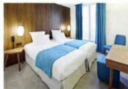
L'Hôtel Best Western Premier 61 Paris Nation, architecture intérieure Axel Schoenert architectes

This is the boutique hotel from Axel Schoenert architectes and it falls into the 'vintage' category. The interior architecture with Zsofia Varnagy harks back to the 60's, updated to contemporary expectations. The furniture typifies the style: modest in dimension, elegant and functional, it has all the post-war features of austerity in form, size and materials. The colours - saffron yellow, emerald green, storm grey, azure blue and heavenly orange all help to transform what used to be the 'Jardins de Paris Nation' hotel. The transformation has moved it upmarket and in the process earned it a fourth star.