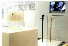
L'exposition "Masque(s)" et l'exposition "Croissance" pendant les D'Days 2013

Afin d'accompagner les professionnels dans le développement de leurs projets, la Direction du Développement Économique, de l'Emploi et de l'Enseignement Supérieur de la Ville de Paris a mis en place les Ateliers de Paris. Grâce à cette structure, tout créateur débutant comme confirmé peut bénéficier d'un lieu d'exposition, d'un accompagnement économique et d'un incubateur ou pépinière. Hébergé aux Ateliers de Paris ou aux Ateliers Paris Design, chaque résident bénéficie d'un accompagnement personnalisé afin de préparer sa création d'entreprise ou de développer son activité. Admission sur dossier et encadrement prolongé hors-les-murs à la clé.